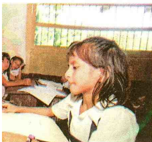
educación básica y superior, afirman.