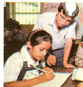
Es importante que una mujer alcance l