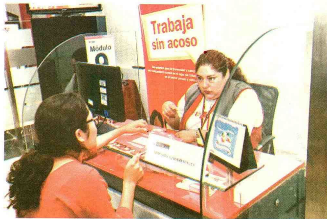
Mayoría de denuncias por acoso en el centro de trabajo fueron desestimadas en 2017.

Día de la Mujer ❖ Según Defensoría del Pueblo, empresas prefieren contratar varones y lactancia. Deserción escolar, acceso a la salud y acoso laboral son algunas de las brechas