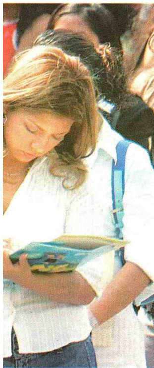
en áreas para las que no estudiaron.

para evitar pérdida de horas por maternidad que todavía afectan a las féminas en el país.