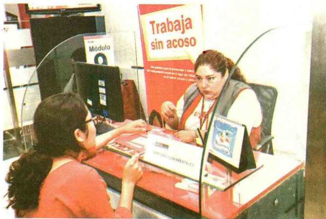
Mayoría de denuncias por acoso en el centro de trabajo fueron desestimadas en 2017.

Día de la Mujer ❖ Según Defensoría del Pueblo, empresas prefieren contratar varones y lactancia. Deserción escolar, acceso a la salud y acoso laboral son algunas de las brechas