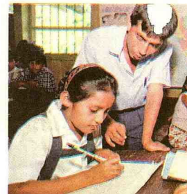
Es importante que una mujer alcance l